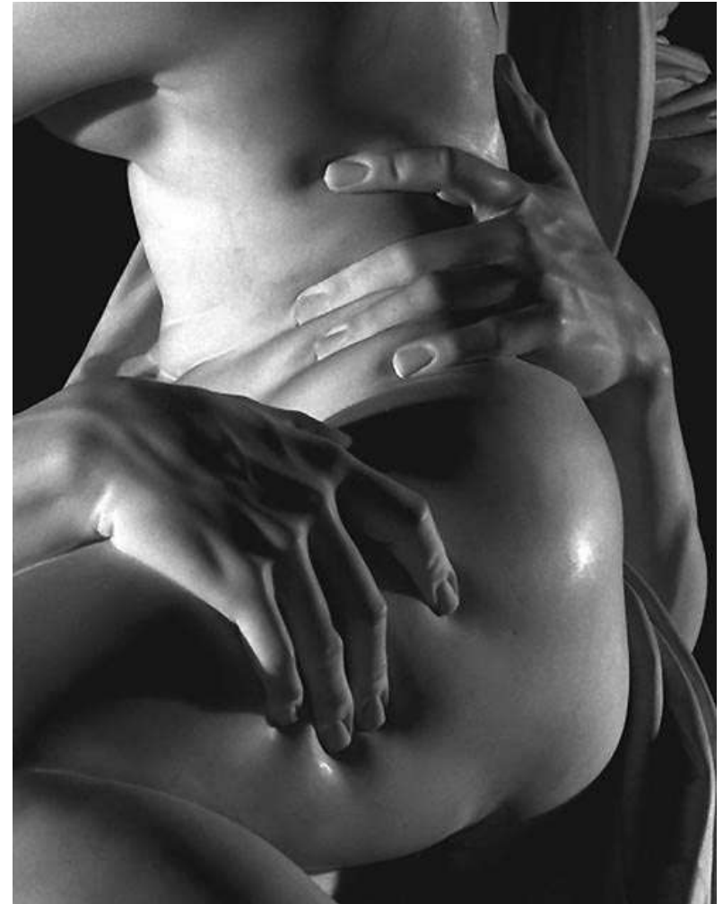
El rapto de Proserpina (1621-1622, Galería Borghese, Roma) Gian Lorenzo Bernini (1598 – 1680)